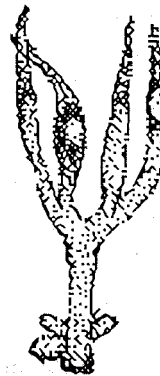
c. Femelle dans le vestibule